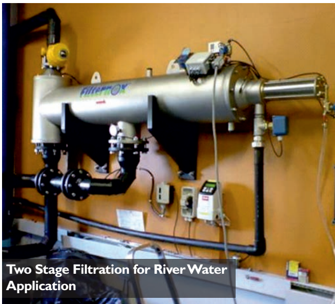
Two Stage Filtration for River Water Application