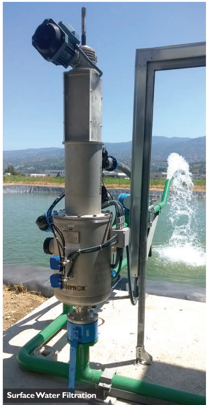
Surface Water Filtration