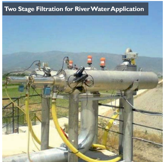
Two Stage Filtration for River Water Application