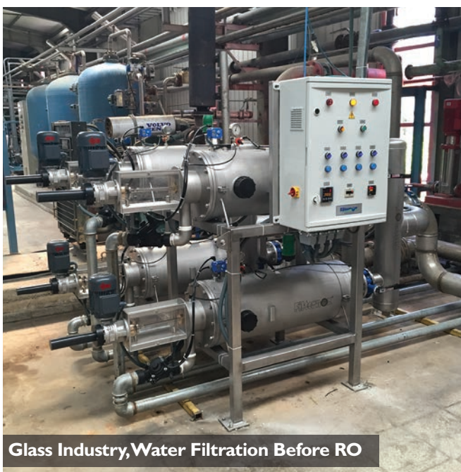
Glass Industry, Water Filtration Before RO